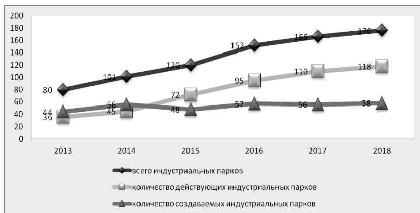
Рис. 2. Динамика создания индустриальных парков в России [8, 23]

но всего в двух федеральных округах – Центральном федеральном округе и Приволжском федеральном округе [23]. Наряду с этим, можно выделить две группы причин, лимитирующих развитие индустриальных парков в России. Во-первых, речь идет об инерционности хозяйственной системы и непродолжительном периоде развития индустриальных парков, значительное количество которых находится на стадиях создания, проектирования или фиксации намерений. Во-вторых, о зачастую узком понимании сущности и содержания деятельности индустриальных парков, что осложняет создание адекватных институциональных, инвестиционных, организационно-управленческих условий их развития. Об этом свидетельствуют такие выделяемые исследователями проблемы функционирования индустриальных парков, как неопределенная и заранее не проработанная концепция создания и структура резидентов, отсутствие стратегии развития, недостаточный уровень инженерной инфраструктуры, высокая стоимость земель, отдаленность рынков сбыта и т.д. [13]. Учитывая особенность индустриальных парков, их успешное создание возможно при участии региональных органов власти и институтов промышленного развития, а эффективное управление на микроуровне должно строиться на базе принципов и механизмов современного менеджмента [11, 14].