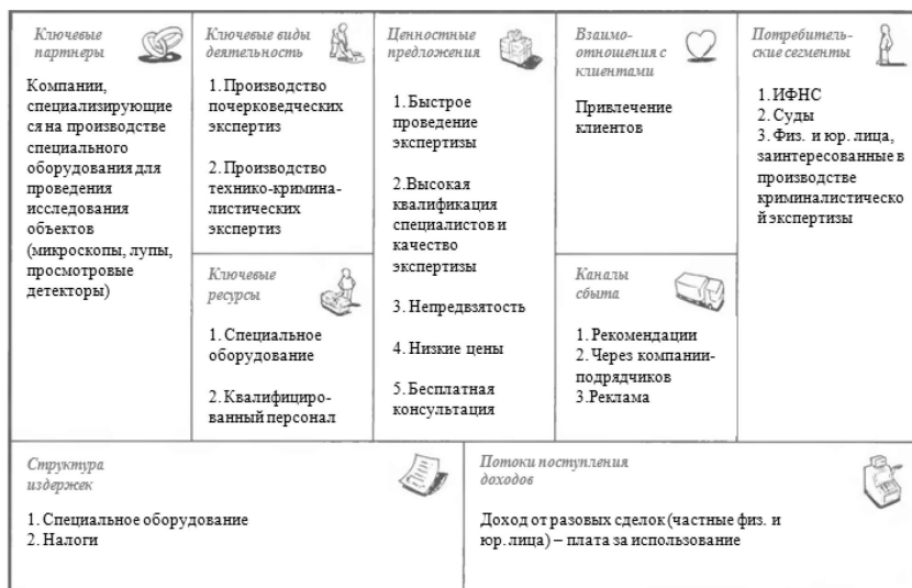
Рис. 2. Модель Остервальдера экспертно-криминалистической организации

База контрагентов включает в себя около 1000 телефонов. Исследования проведены по более чем 1000 проверяемым лицам, что нашло свое отражение в модели Остервальдера, показанной на рисунке 2.