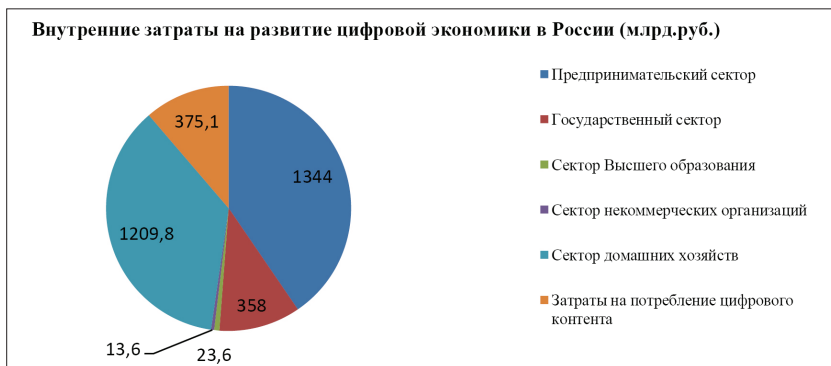
Рис. 2. Структура внутренних затрат на развитие цифровой экономики в России

Процесс глобализации, в основе которого лежит стремительное нарастание информационных потоков, существенно усложняет внешнюю и внутреннюю среду предпринимательской структу-