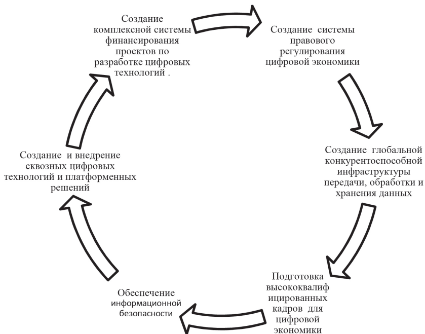
Рис. 1. Задачи национального проекта «Цифровая экономика» [7]