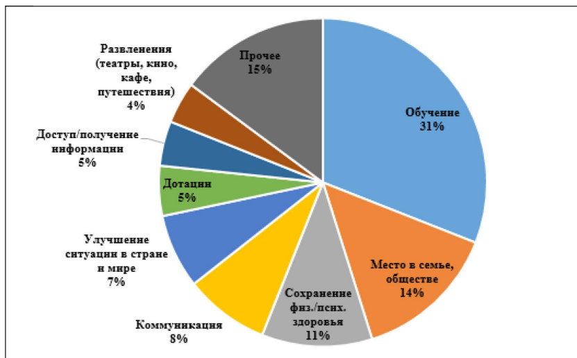
Рис. 2. Категории желаний второй группы: 72–63 год (53 человека)

На третьем месте располагается желание иметь место в семье и обществе (14%). Для этой возрастной группы потребность социализироваться в современном обществе становится более актуальной, чем для предыдущей. На четвертом месте стоит желание сохранить свое психическое и физическое здоровье (11%). Далее идут пять категорий желаний с низкими количественными показателями (от 8 до 4%): коммуникация (8%), улучшение ситуации в стране и мире (7%), дотации (5%), доступ / получение информации (5%), развлечения (4%). Такое сильное разложение желаний и интересов может говорить о сильной слоистости данной возрастной группы. В основании этой слоистости могут лежать разные социальные предпосылки: противоречия между коллективистской и индивидуалистической культурой (так как именно в этой группе есть представители и той, и другой), предыдущий статус в обществе и профессия, отношения в семье и др. Данных этого эмпирического исследования недостаточно, чтобы с уверенностью говорить об основаниях этого явления. Выявление этих оснований является плодотворной темой для дальнейших исследований.