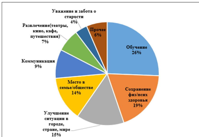
Рис. 1. Категории желаний первой группы: 82–71 год (26 человек)

ного из всех ответов данной группы) включает в себя следующие слова: знание (21 слова синонимичного ряда), интересный (12 слов), новый (8 слов). Фразы, в которых используются эти слова, не имеют поясняющих определений, в основном они выражают общее стремление к знанию: «получать новые знания» (ж., 1942), «познать новое» (ж., 1943), «чего-то познавательного» (ж., 1941). Проще говоря, пожилые люди не знают, чему хотят учиться. Единственная область знания, которую большинство из них непременно готово изучать – это компьютерная грамотность. Сюда входит владение компьютером, планшетом и смартфоном. Что касается стремления к познанию неопределённого нового, то с первого взгляда его можно принять за любознательность. Однако эта особенность указывает на возможность существования другого явления – зависимости познавательных желаний пожилых людей от их страхов. Эту гипотезу подтверждают другие желания, которые пожилые описывают вместе с желанием изучения «нового», это: не отставать от жизни, быть современной, более грамотной, не быть обузой.