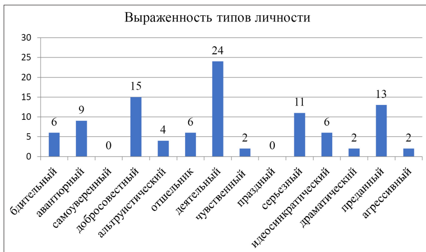
Рис. 1. Преобладающие типы личности по методике Олдхэма-Морриса

В ходе исследования нами был выявлен низкий уровень психопатизации у 35% респондентов, 33% респондента попали в зону неопределенного результата (-5 до +5 по шкале психопатизации), патология по шкале психопатизации была диагностирована у 32% респондентов. Результаты по методике определения типа личности Олдхэма-Моррис, представленные в процентном соотношении, обнаружили преобладающие типы личности (см. рис. 1).