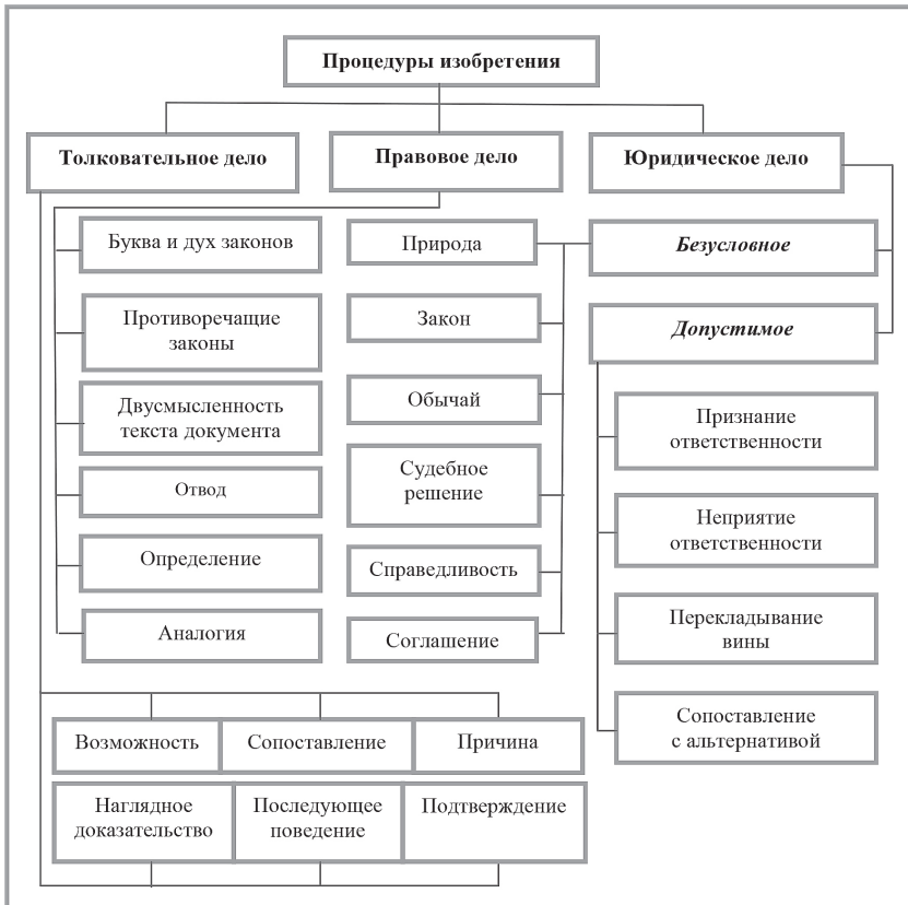
Рис. 1. Процедуры изобретения судебных речей

дывается из шести этапов: рассмотрения возможности совершения преступления подсудимым, сопоставления преступления с выгодой, которую подсудимый мог из него извлечь, рассмотрения признаков преступления, указывающих на подсудимого, наглядных доказательств его вины, изучения последующего за преступлением поведения подсудимого и, наконец, подтверждения его вины.