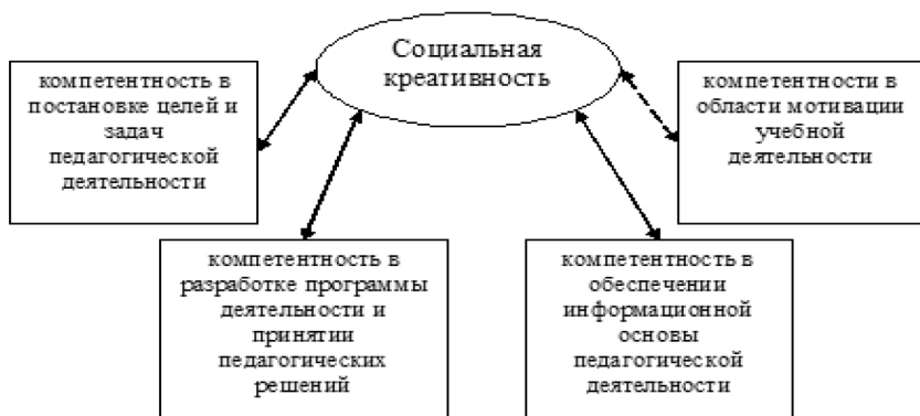
Рис. 3. Значимые взаимосвязи социальной креативности личности и базовых педагогических компетентностей учителей

Далее проводился корреляционный анализ между показателем социальной креативностью и педагогическими компетентностями. Корреляционный анализ установил, что существует взаимосвязь между педагогическими компетентностями и уровнем социальной креативности (рис. 3). По коэффициенту Пирсона были обнаружены прямые умеренные взаимосвязи между уровнем социальной креативности и следующими педагогическими компетентностями: компетентность в постановке целей и задач педагогической деятельности ( r=0,393 при p<0,01 ), компетентность в разработке программы деятельности и принятии педагогических решений ( r=0,638 при p<0,01 ), компетентность в обеспечении информационной основы педагогической деятельности ( r=0,300 при p<0,05 ). Также была обнаружена слабая взаимосвязь между уровнем социальной креативности и компетентности в области мотивации учебной деятельности ( r=0,296 при p<0,05 ).